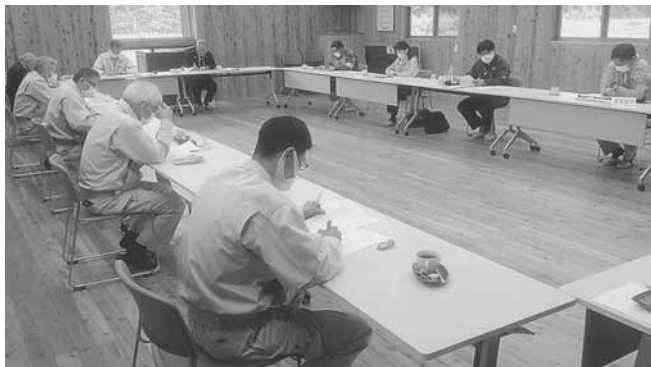
第二回会議の様子 (陸前高田市森林組合事務所にて)