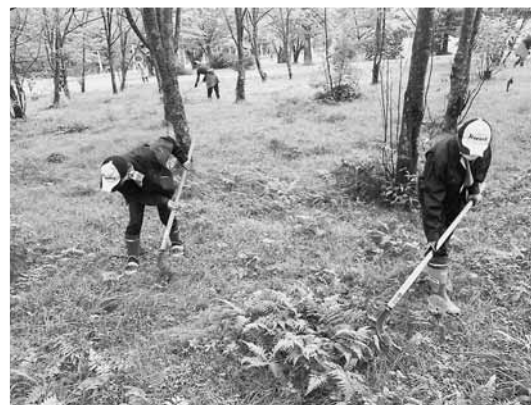
県民の森 下刈の様子

また後半では、昨今SDGsに対する企業としての取組みが注目される中、岩手県森連としてのSDGsへの取組みと、関連した経営理念(案)